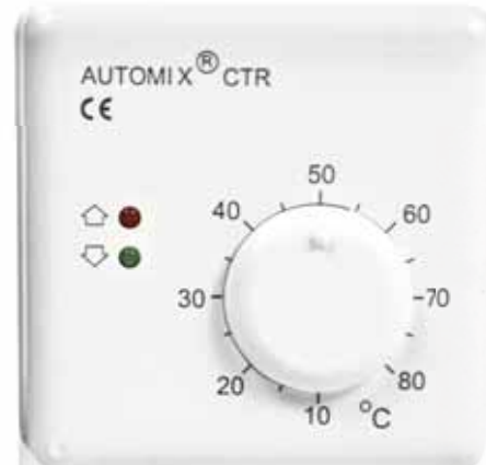
AUTOMIX CTR huoneyksikkö